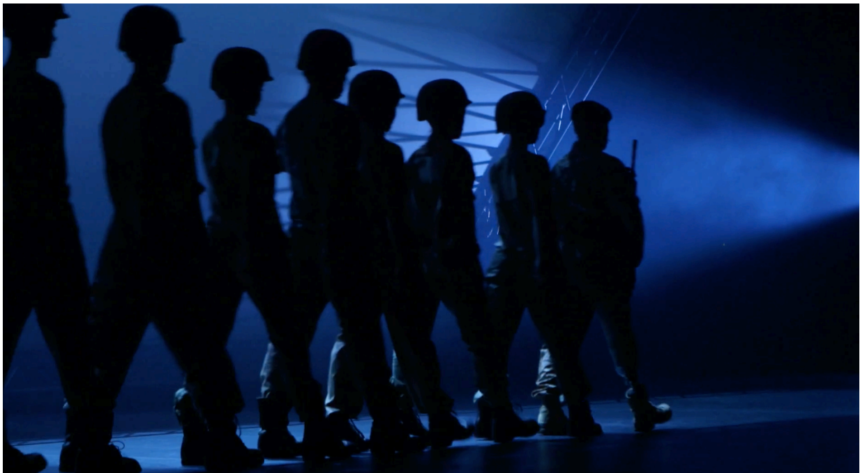
Framegrab fra Krigsdans