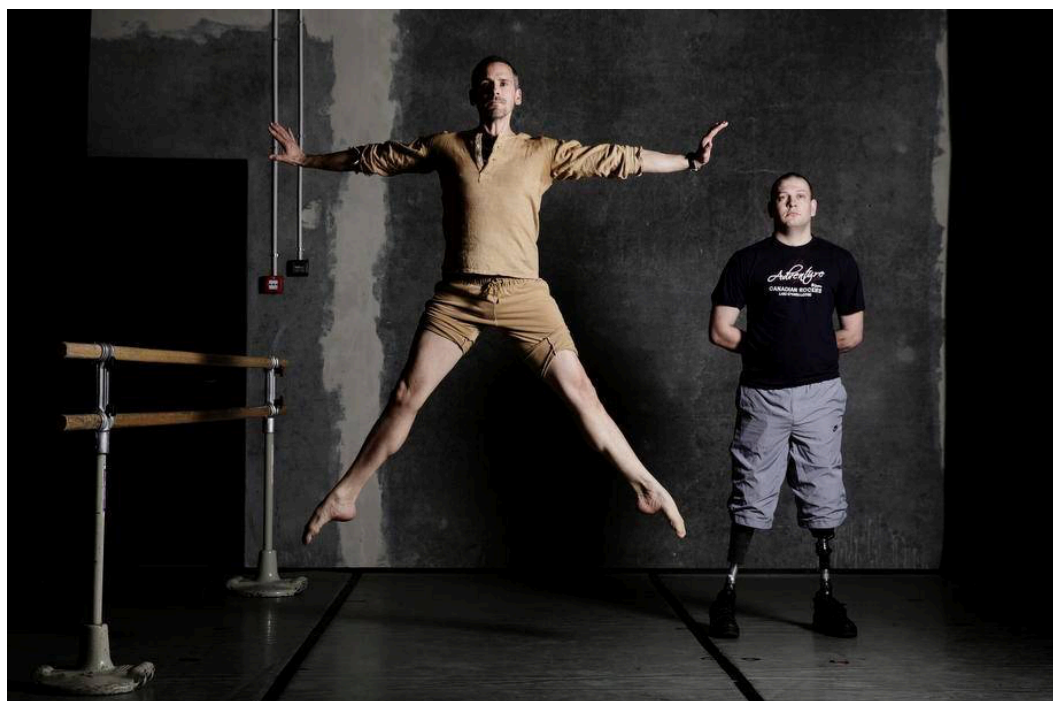
PR-foto fra Det Kongelige Teaters reklame for forestillingen I Føling