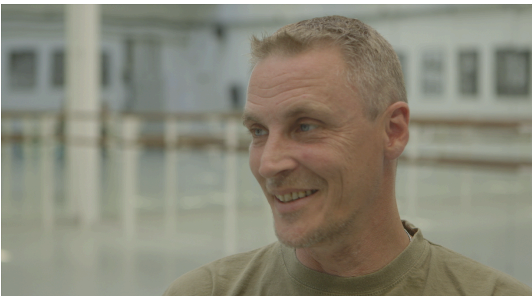
Framegrab fra Krigsdans